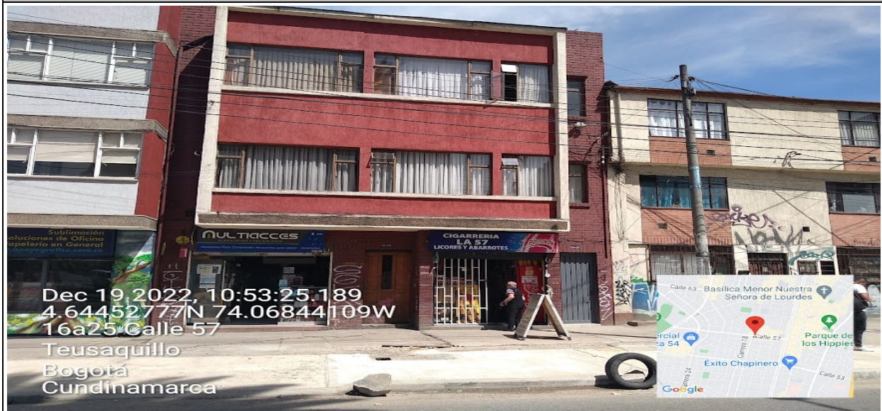
Vista panorámica del predio en el que se sitúa el establecimiento comercial denominado MULTIACCES ubicado en la CL 57 No. 16 A – 30 .